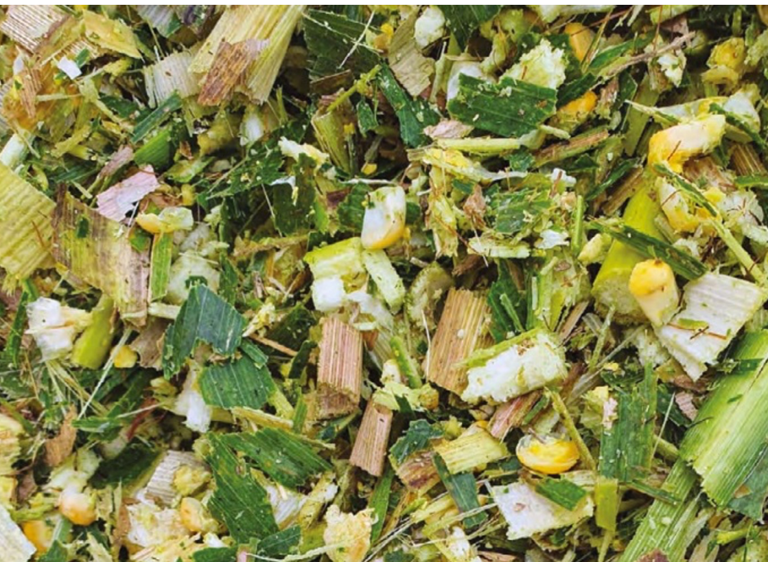
Figura 10. Detalhe da composição da fração fibrosa e grãos em silagem de milho.

fibra de forragem limitam o consumo de matéria seca, pois uma fração é indigestível ou de degradação lenta, ocupando grande espaço no úmen, o que pode levar ao consumo abaixo do necessário para atender às exigências nutricionais. Valores médios ideais de silagem de FDN são inferiores a 45%, variando entre 36 e 45%.