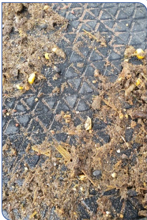
Figura 5. Amido fecal decorrente do mal processamento dos grãos de milho durante o processo de ensilagem.