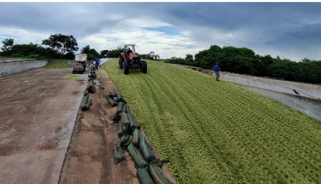
Figura 6. Processo de compactação de silagem de milho.

No silo de trincheira, um grande entrave é acumular quantidade de silo acima do limite da parede. O material que fica acima é menos compactado, fica em maior contato com a superfície e é mais poroso, ou seja, sofre mais perda por deterioração. A indicação, por essa razão, é abastecer o silo até o limite das paredes com declividade longitudinal da massa, de modo que o fundo seja mais alto que a frente para evitar acúmulo de água no fundo ao ocorrerem chuvas.