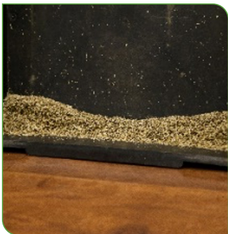
Figura 4. Resultado de avaliação de silagem de milho com uso do conjunto de peneiras Penn State. Em ordem: 19 mm; 8 mm; 4 mm e fundo.