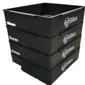
Figura 3. Conjunto de peneiras (Penn State) e percentuais de retenção do volumoso desejado.