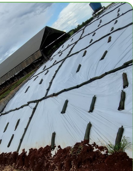
Figura 8. No entanto, é importante acrescentar uma lona convencional ou uma rede de proteção física, pois filmes não têm tratamento contra raios UV. Dessa maneira, alcança-se excelente vedação.

menor que 48% e, de amido, maior que 30% na MS, além de haver microrganismos indesejáveis na parte superior.