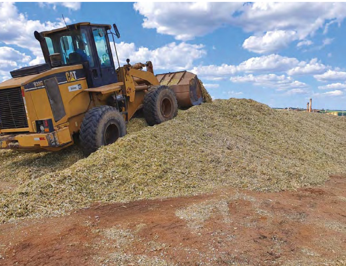
Figura 7. Uso de implemento pesado para compactação de silo do tipo superfície.

Além disso, o tempo deve ser observado. Ele deve ser o mesmo do turno da colheita, ou seja, enquanto a colheita do material estiver sendo feita, o trator de compactação também deve estar atuando.