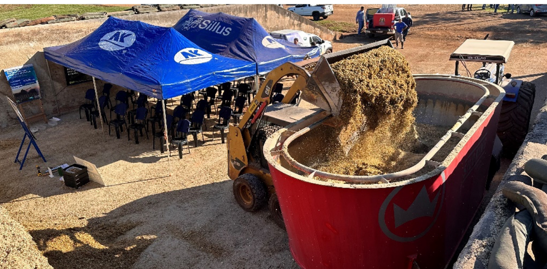
Figura 9. Remoção da silagem de milho para fornecimento aos animais.

Uma boa prática importante no processo de desabastecimento é colocar peso na lona nos 2 metros de superfície a partir da abertura para minimizar a entrada de oxigênio para o interior do silo.